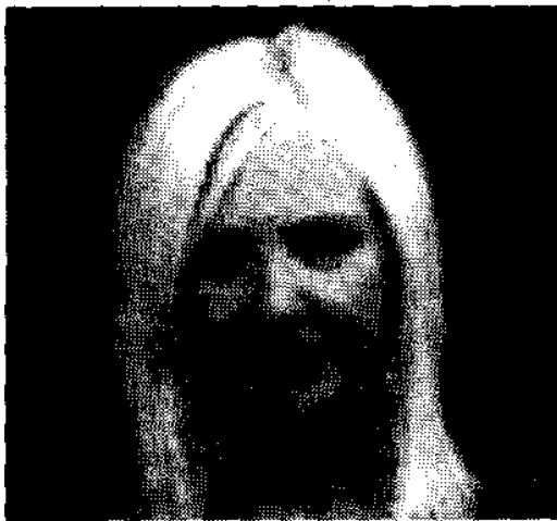
Rhonda Byrne nos revela su secreto.

Rhonda Byrne, "El secreto". Ediciones Urano. Barcelona. 2007. 207 páginas, 22 euros.